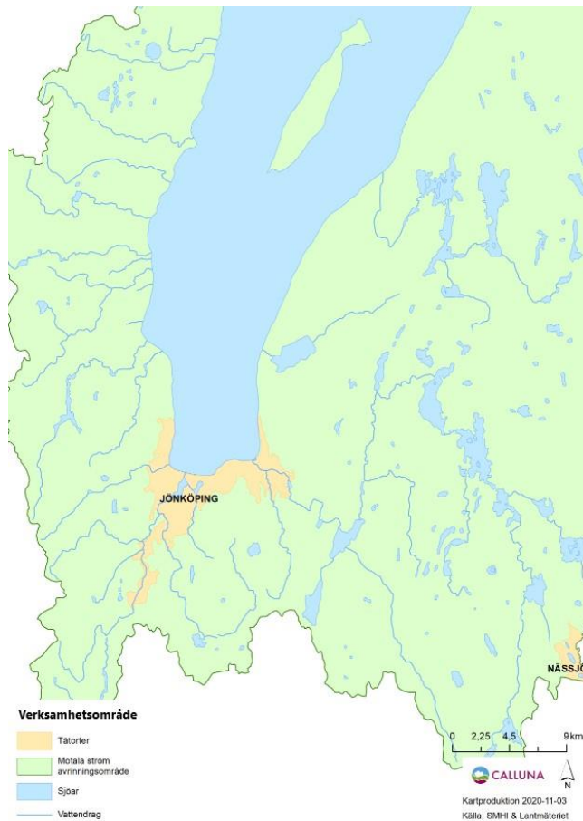
Fig 1. Karta över verksamhetsområdet för SRK Södra Vättern

I avrinningsområdet finns andra pågående undersökningar såsom uppföljning av kalkningsverksamhet och restaurering, lokal och regional samt nationell miljöövervakning. Recipientkontroll Södra Vätterns Tillflöden ingår som del av Vätterns avrinningsområde. Miljöövervakning av utsjön administreras av Vätternvårdsförbundet, i norra Vättern finns motsvarande recipientkontroll som för södra Vättern. En mindre del av recipientkontrollen i Vätterns tillrinningsområde, som utgörs av tillflöden i Östergötlands län, administreras av Motala Ströms Vattenvårdsförbund. Alla undersökningsprogram ska så långt som möjligt vara samordnade och ge stöd till varandra.