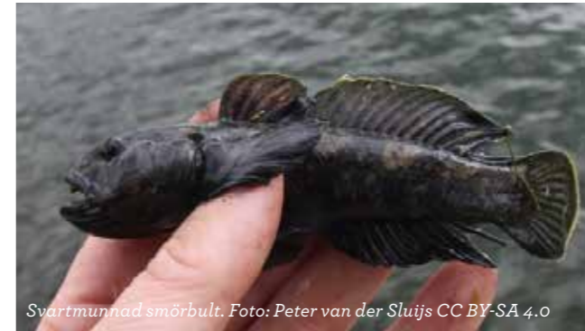
Svartmunnad smörbult.

Solabborre påträffades för första gången i Sverige 2012 i sjön Åsnen i Småland. Den har tidigare spridits till stor del genom handel med arten, men den kan också rymma och förvildas. Det finns risk att arten etablerar sig i Sverige. Solabborren är färgglad och dess kropp är hög i förhållande till längden. Den blir omkring tio centimeter lång, men kan bli betydligt längre i sitt naturliga utbredningsområde. Solabborren kan sprida fiskparasiter till våra inhemska arter och denna snäckätande fisk kan även påverka undervattensväxterna negativt.